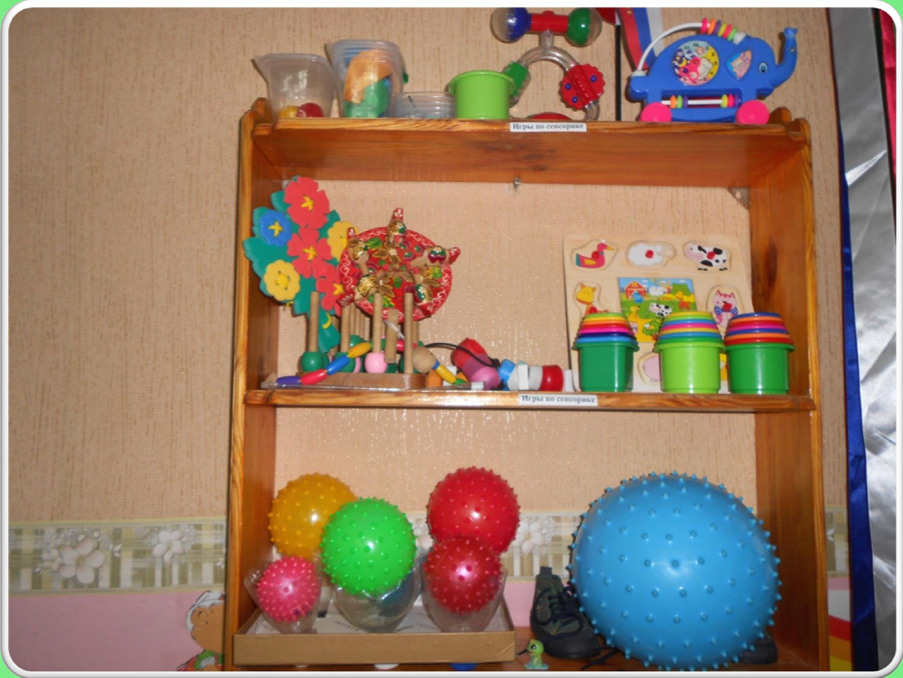
Игры по сенсорике